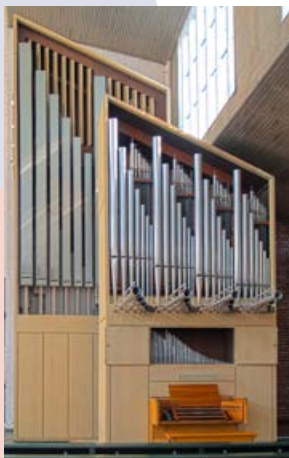
Kath. Pfarrkirche, Klais-Orgel (1975) 3 Manuale · 42 Register