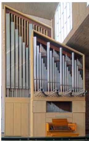
Kath. Pfarrkirche, Klais-Organ (1975) 3 Manuale · 42 Register